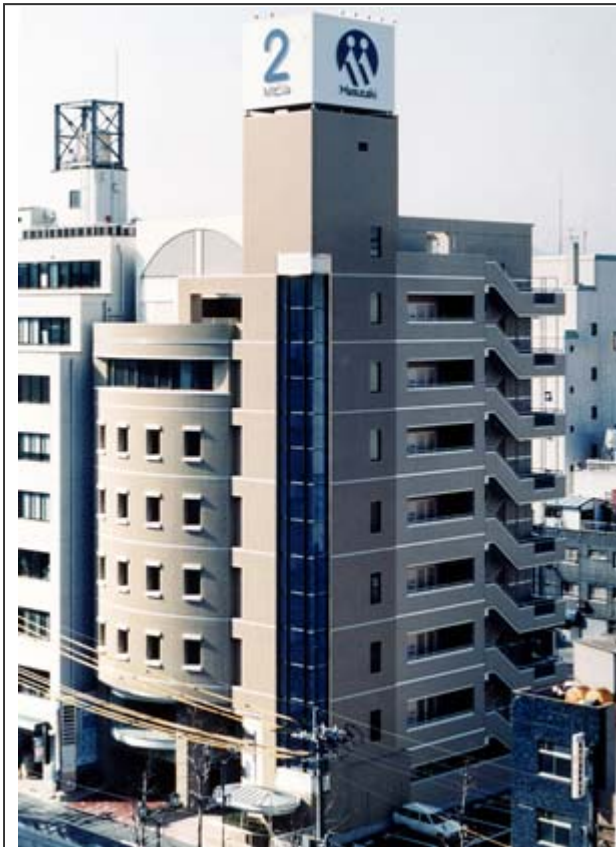
Mビル2号館外観写真拡大する