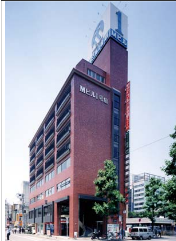
Mビル1号館外観写真拡大する